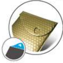
Custom made lip shape Patte personnalisée