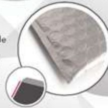
Manual: - 5mm per side Manuelle: - 5mm de chaque côté