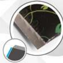
Automatic: - 10mm per side Automatique - 10mm de chaque côté