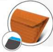
Diagonal corner cut En diagonale