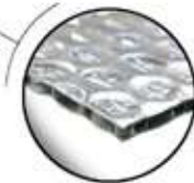
Single Layer Air Bubble 650 gr/ m2