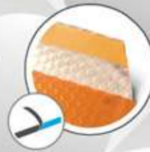
Manual: - Bi-adhesive tape Manuel: - Pâte Bi-adhésive extra résistante