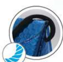
Handle cord - black Cordelette - noir