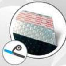
Automatic: - Hot-melt adhesive Automatique - Pâte Bi-adhésive extra résistante