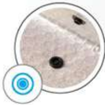
Button - black or white Bouton pression - noir ou blanc