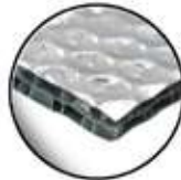
Doble Layer Air Bubble 850 gr/ m2